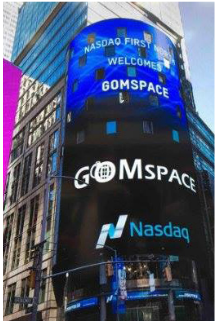
"GOMX"-aktien släpptes på Nasdaq i Stockholm och den första handelsdagen var den 16 juni.

GomSpace ledning har övervägt olika alternativ för att nå sitt långsiktiga strategiska mål att ta till vara företagets tillväxtpotential. En börsintroduktion skulle ge GomSpace tillgång till tillskottskapital och göra företagets ställning ännu starkare än i dag. GomSpace skulle betraktas som en ledande leverantör av komponenter, plattformar och uppdrag/projekt till flygindustrin. GomSpace kommer att ansöka om notering på Nasdaq OMX First North Premier i Stockholm.